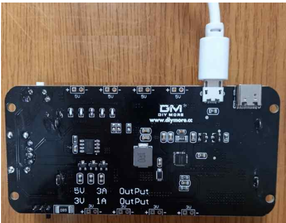
(Micro USB 충전단자로 충전)