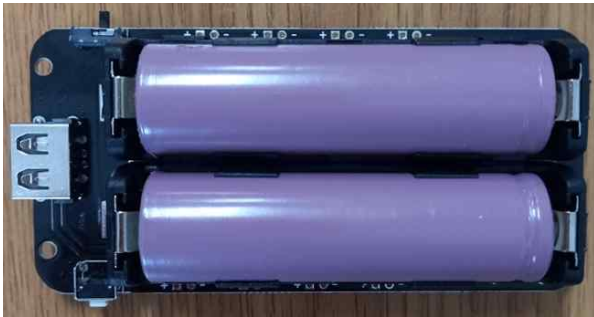
(18650 Size 리튬 배터리가 장착된 모양)