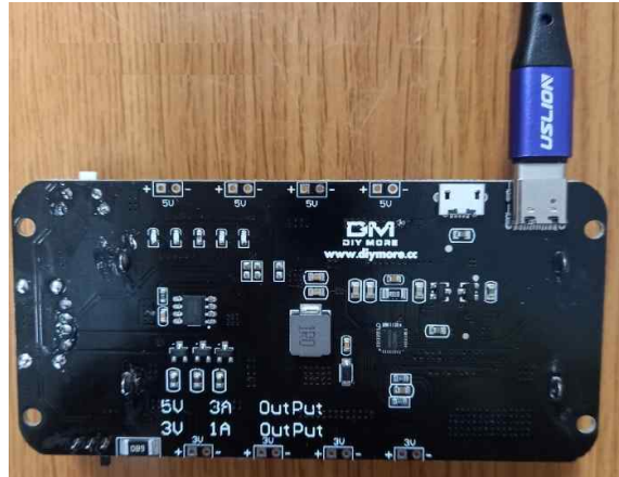
(Type-C USB 충전단자로 충전)