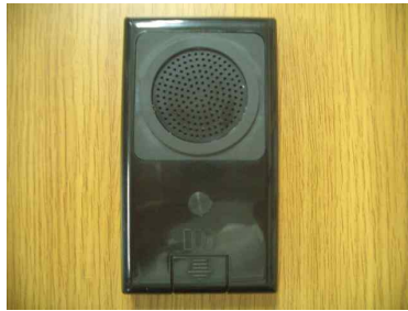
(제품 후면의 모양)