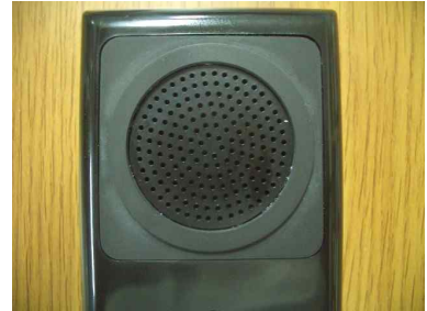
(제품 뒷면의 스피커 모양)