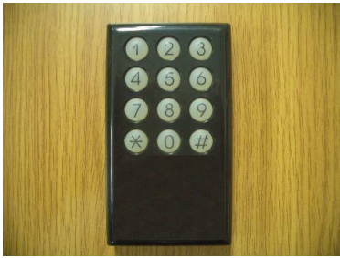
(제품 전면의 스위치 모양)