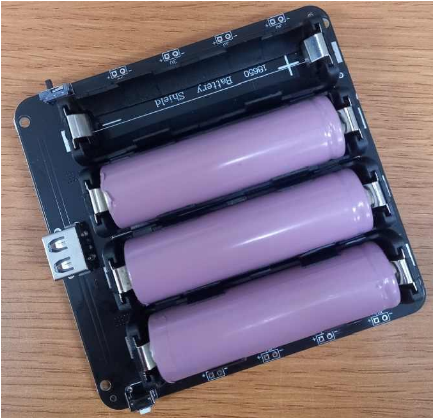
(18650 Size 리튬 배터리 3개를 장착한 모양)